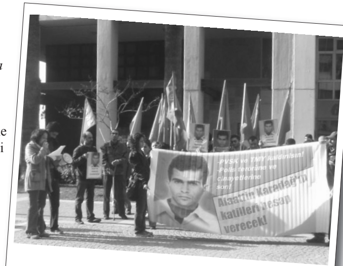
17 Kasım 2012 | İzmir