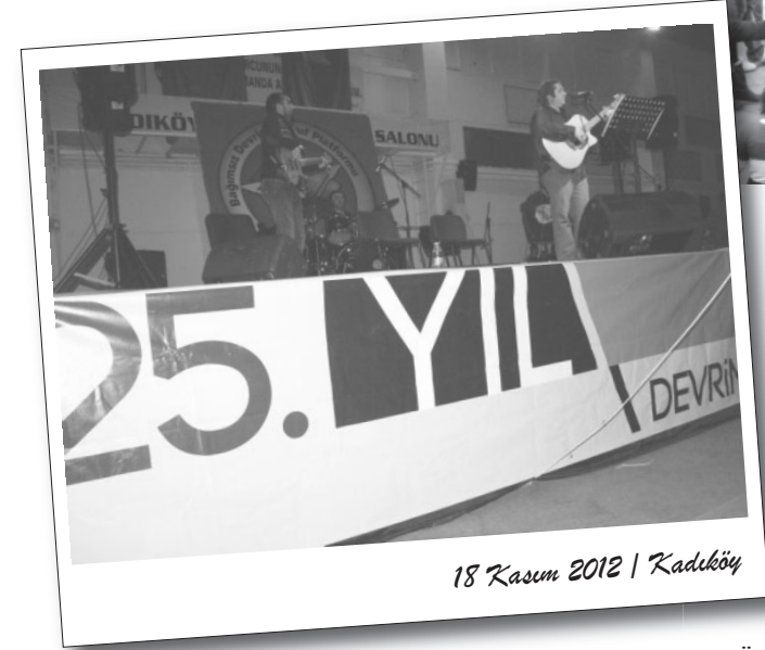
18 Kasım 2012 | Kadıköy

demistik. 1917 Ekimi'nde buzu kırıp yolu açan Ekim Devrimi'nin ışığında güne yüklenerek geleceği kazanma adımlarını hızlandırdık" denerek Ekim Devrimi'nin selamlanmasıyla sürdü.