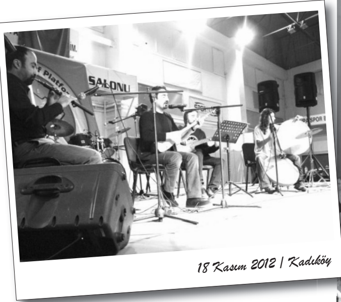
18 Kasım 2012 | Kadıköy