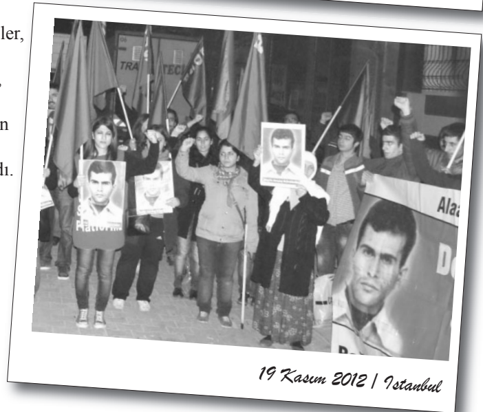
19 Kasım 2012 | İstanbul